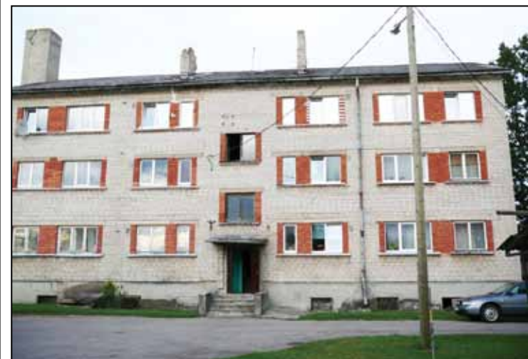
• Ēka Baznīcas ielā 6 pirms renovācijas

Viesturs Liepa, SIA „Zeiferti” valdes loceklis