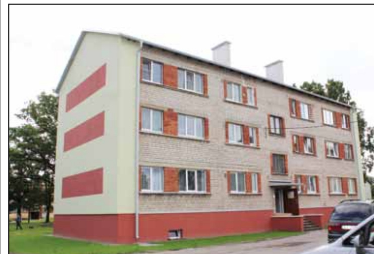
• Ēka Baznīcas ielā 6 pēc renovācijas